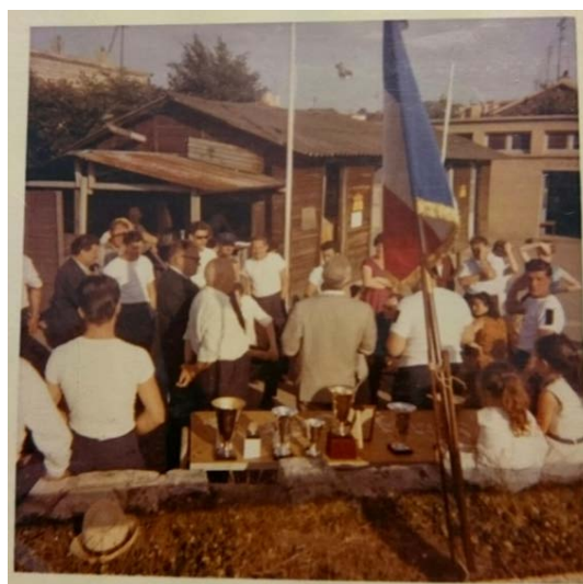
Les archers dans le Jeu d'Arc, et le logis d'Issy-les-Moulineaux en 1961.

Tout juste reformée, la Compagnie d'Issy-les-Moulineaux reprend l'organisation de son Prix Général et sa « vie de Compagnie ». A partir de 1955 – il y a alors 16 archers à Issy 6 – jusqu'en 1972 7 est mentionnée l'appartenance à la Famille de la Banlieue Nord de la Seine-et-Oise : cette Famille a été fondée en 1927 8 et comptait pour principales Compagnies Ermont, Montmorency, Montmagny et