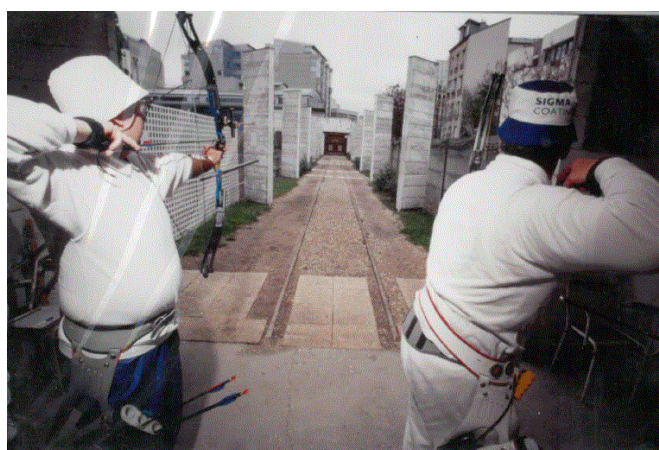
Le pas de tir 50 m et le Jeu d'Arc dans les années 1990-2000.