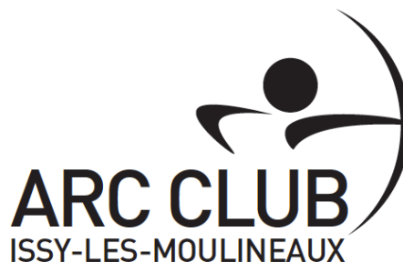
Les écussons du club, des années 60 à nos jours.