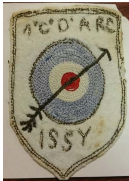
Le drapeau et l'insigne d'origine de la Compagnie d'Arc d'Issy-les-Moulineaux.