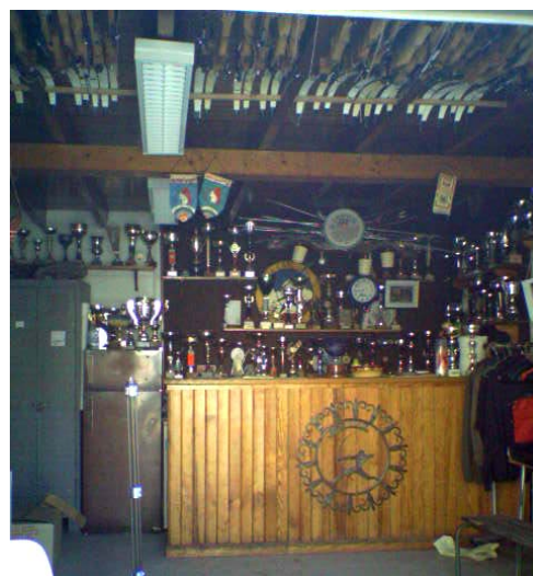
L'inauguration du logis en 1976 (11) et vue de l'intérieur en 2005.